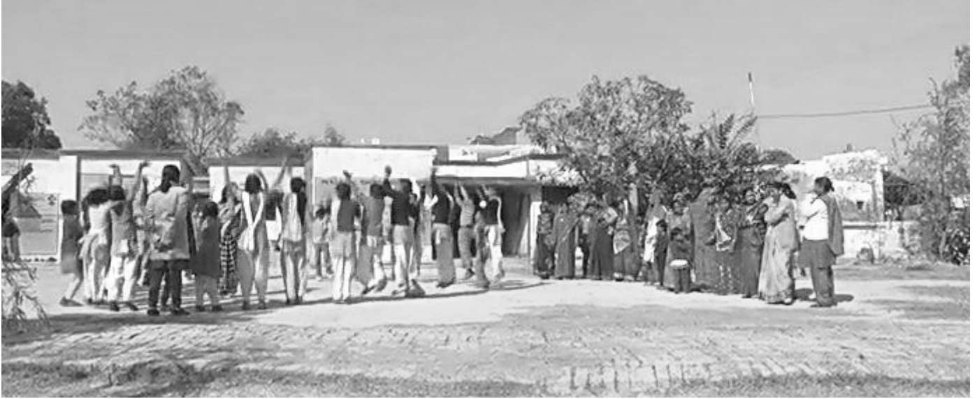
চিত্ৰ ১ : আপোনাৰ বিদ্যালয়ত অন্তৰ্ভুক্তি শিক্ষাৰ বিকাশ সাধন

নির্দেশ দিছে। সেয়েহে বিদ্যালয় প্রধান দলপতি হিচাপে এইটো আপোনাৰ দায়িত্ব যাতে আপোনাৰ বিদ্যালয় পৰিমণ্ডলত সামগ্ৰিক চিন্তাৰথমনোভাৱৰ প্ৰসাৰ আৰু প্ৰতিপালন সযতনে হয়।