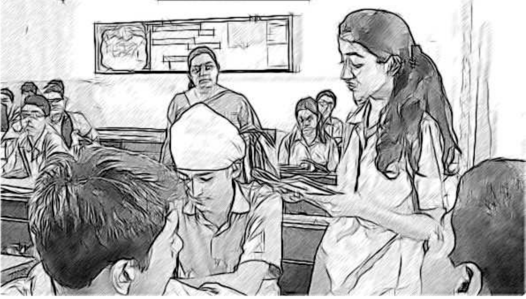
চিত্র- 3 ক্ষেত্র ভ্রমণৰ ওপৰত এটি সাধু / কাহিনী কোৱা

আমাক সোণাপুৰলৈ লৈ গৈছিল। এইটো আমাৰ দ্বিতীয় আৰু বোধহয় শেষ ক্ষেত্র ভ্রমণ আছিল। আমি অষ্টম শ্ৰেণীত থাকোঁতেও সোণাপুৰলৈ গৈছিলো। আচৰিত ভাবে, সোণাপুৰত এইবাৰ আমি যি কৰিছিলো, আগৰ অভিজ্ঞতাৰ পৰা সম্পূৰ্ণৰূপে বেলেগ আছিল। সকলোবোৰ ব্যৱস্থাৰ মাজত ভাল সমন্বয় আছিল আৰু আমি খুব আনন্দ কৰিছিলো।