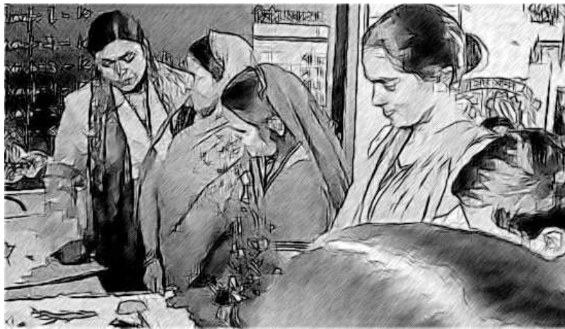
চিত্ৰ- 5 ছাত্ৰ-ছাত্ৰীৰ গুৰুত্বপূৰ্ণ কাৰ্যত অভিভাৱকসকলক জড়িত কৰা

আপুনি ভবা কথাবোৰ আপোনাৰ শিকন দিনলিপিত টুকি ৰাখক। এই গোটটোৰ শেষত আপুনি এই নিৰীক্ষা (audit) পুনৰ চাবলৈ সুযোগ পাব আৰু পিছৰ ম্যাদৰ বাবে এটা পৰিকল্পনা কৰিব পাৰিব।