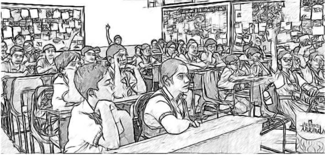
চিত্ৰ- 2 আন বিদ্যালয় আৰু বে- চৰকাৰী সংগঠন সমূহৰ সৈতে একেলগে মিলি কাম কৰিলে আপোনাৰ ছাত্ৰ-ছাত্ৰী উপকৃত হ'ব।

একেদৰে, আপুনি কিছুমান স্থানীয় স্বৈচ্ছসেৱী সংগঠন (বে-চৰকাৰী সংস্থা, সাধাৰণতে NGO কোৱা হয়) সমূহৰ লগতো অংশীদাৰী হিচাবে কাম কৰিব পাৰে। আপোনাৰ বিদ্যালয়ৰ শিক্ষাৰ গুণগত মান বৃদ্ধি কৰিবৰ বাবে এই সংগঠন সমূহে বিভিন্ন শিক্ষণ আৰু শিকন সমল, পদ্ধতি, শিকন সামগ্ৰীৰ যোগান ধৰি আৰু সৰ্বোত্তম শিক্ষণ প্ৰত্ৰি যাবোৰ আদান-প্ৰদান কৰি এটা বিকল্প পদ্ধতিৰে কাম কৰি আপোনাৰ বিদ্যালয়ক উপকৃত কৰিব পাৰে।